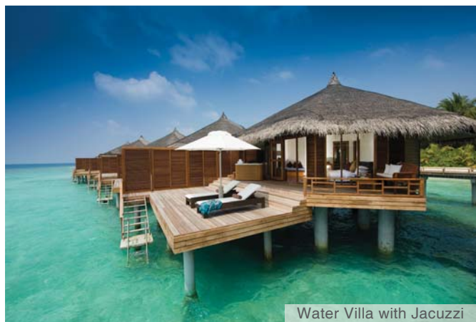
Water Villa with Jacuzzi