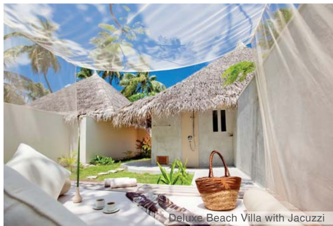
Deluxe Beach Villa with Jacuzzi