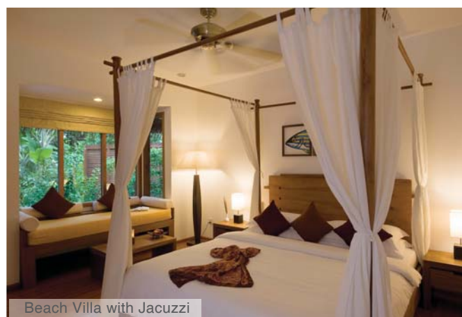
Beach Villa with Jacuzzi