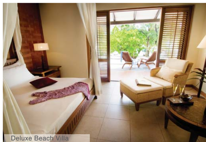
Deluxe Beach Villa