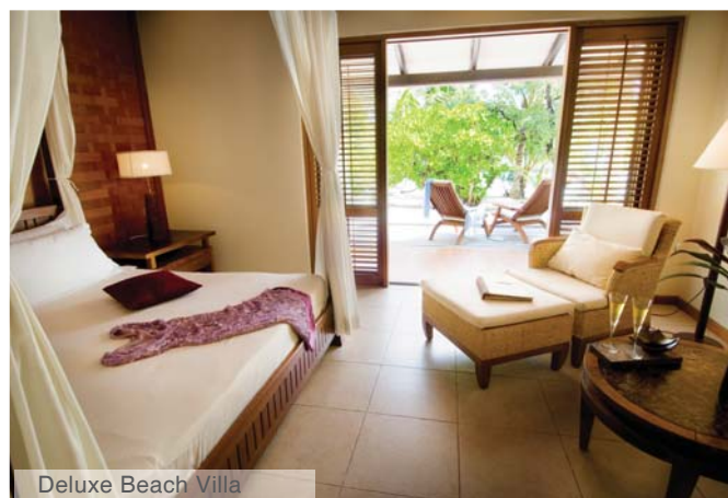
Deluxe Beach Villa