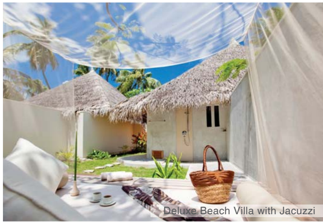
Deluxe Beach Villa with Jacuzzi