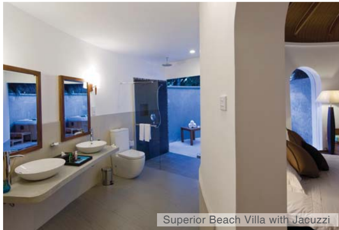
Superior Beach Villa with Jacuzzi